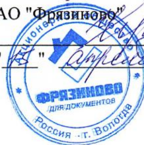
ГРАФИК ПЛАНОВЫХ ПРОВЕРОК ВЕНТИЛЯЦИИ И ДЫМОХОДНЫХ КАНАЛОВ МКД С ИНДИВИДУАЛЬНЫМИ ГАЗОВЫМИ КОТЛАМИ находящихся в управлении АО "Фрязиново" 2026 год.