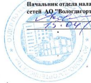
График подготовки к отопительному периоду 2026-2027 годов жилых домов находящихся в непосредственном управлении в АО "Фрязиново"